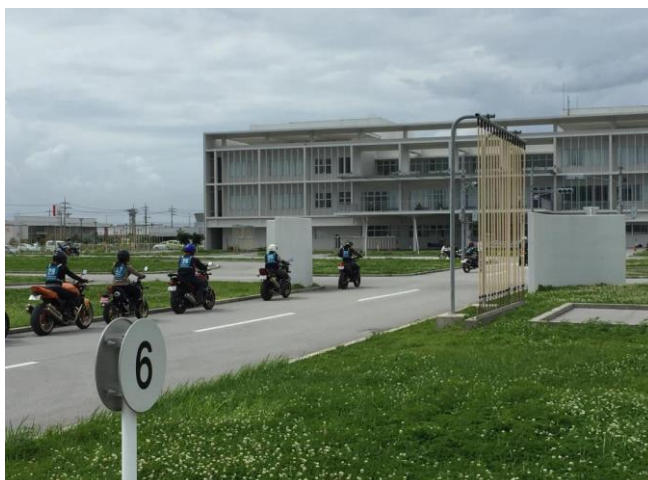
【コンビネーションスラローム】