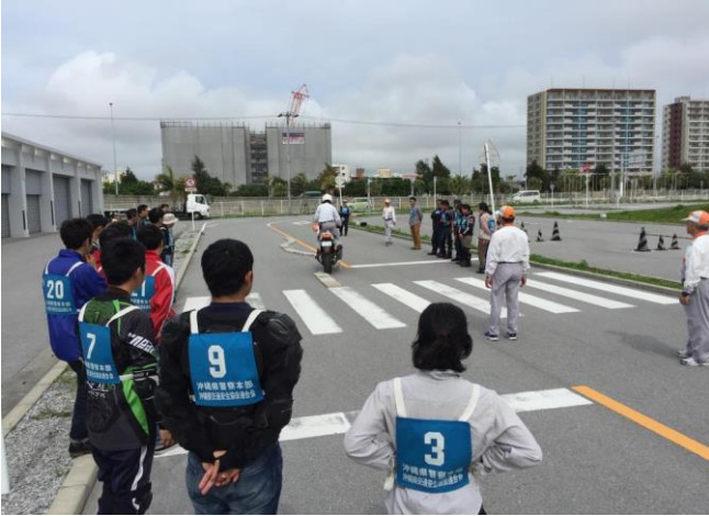
【ブロックスネーク(模範)】