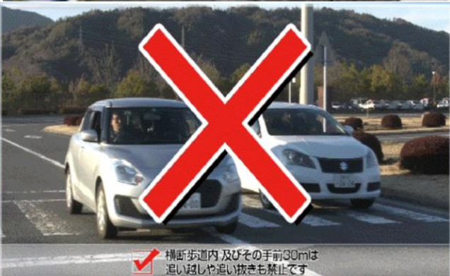
横断歩道内及びその手前30mは追い越しや追い抜きも禁止です