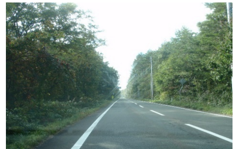
ポイント3 岩手高原 スノーパーク