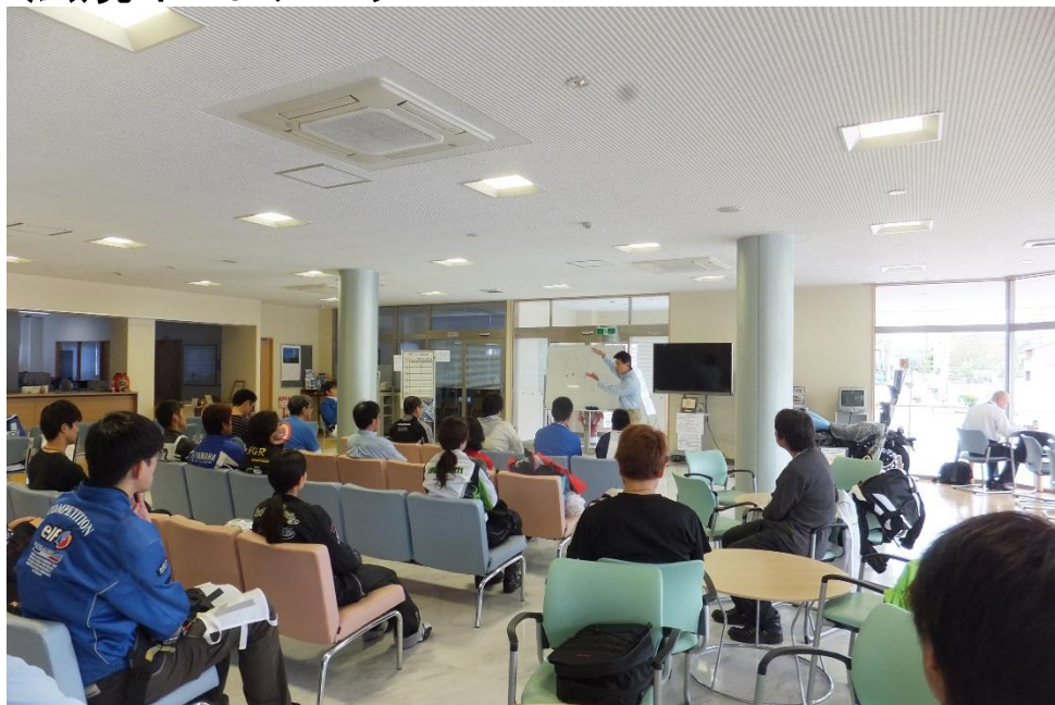
法規インドアレッスン