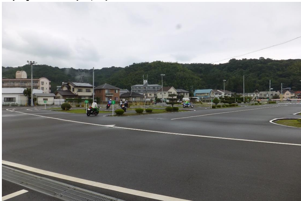
ウォーミングアップ