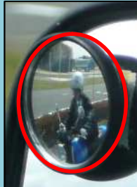
左補助ミラーで二輪車を確認