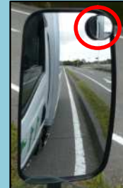
右サイドミラーの視認状況