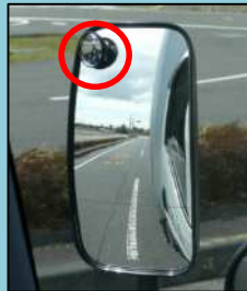
左サイドミラーの視認状況