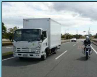
後方の緊急車両と斜め後方の二輪車