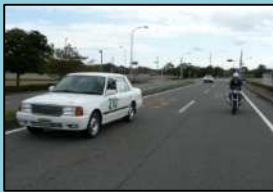
後方の緊急車両と斜め後方の二輪車