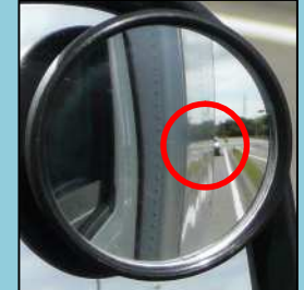
右補助ミラーで緊急車両を確認